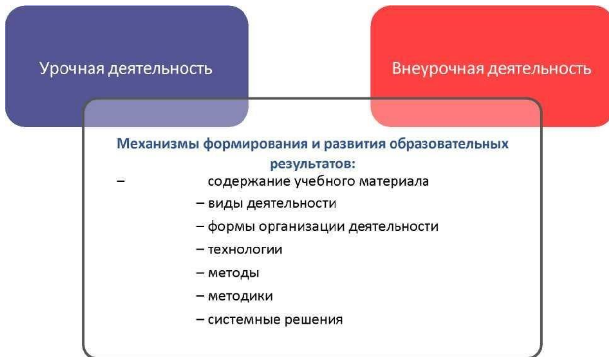
Рис. 7. Механизмы формирования и развития образовательных результатов

Характеристика личностных, метапредметных и предметных результатов отражена в рабочих программах по предметам, курсам, модулям, в том числе внеурочной деятельности (раздел 2)